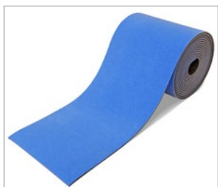
• Art. 23005 Anlaufbahn