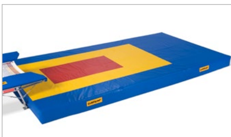
• Art. 26101 Landematten-Überzug