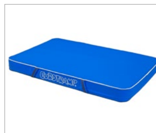
• Art. 28600 Eurotramp Schiebematte